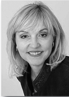
Dr. Beate Merk, MdL

Das Jahr 2011 wurde unter dem Motto „Freiwillig. Etwas bewegen!“ von der Europäischen Kommission zum „Europäischen Jahr der freiwilligen Tätigkeit“ ausgerufen. Dies unterstreicht die besondere Bedeutung, welche der ehrenamtlichen Betätigung der Bürgerinnen und Bürger in unserer Gesellschaft zukommt.