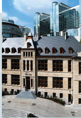
Das ehemalige Institut vor dem Europäischen Parlament

Das Gebäude der Bayerischen Vertretung liegt am Park Leopold nicht nur in einer schönen, sondern auch in einer ganz zentralen Lage im Herzen des Europaviertels. Es gibt kaum einen Standort in Brüssel, der so nahe bei den Schaltzentralen der europäischen Politik liegt. Das Parlament und der Ausschuss der Regionen befinden sich in unmittelbarer Nachbarschaft.