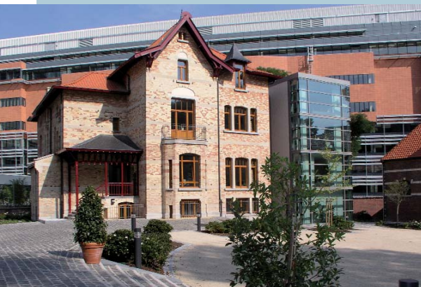
Ehemalige Villa – heute Büroge- bäude der Bayerischen Vertretung

Das alte Marstallgebäude bildet den Zugang für den großen Veranstaltungssaal, einen Neubau mit modernster Technik. Der Saal bietet bis zu 300 Personen Platz, im Untergeschoss befindet sich ein Bierkeller. Auch die Materialien dieses Neubaus passen sich den historischen Baustoffen an. Im alten Marstallgebäude ist die Servicezone für den Veranstaltungsbereich. In dieser wurden das Foyer und die Traiteurküche für den großen Saal untergebracht.