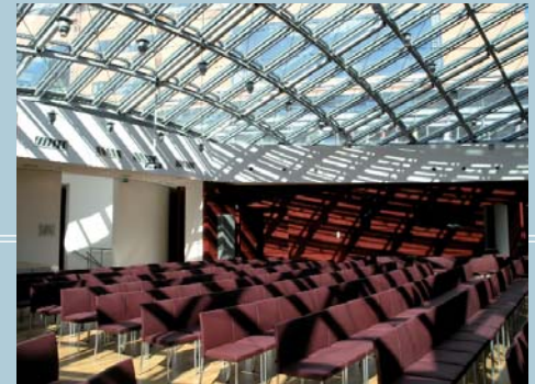
Großer Veranstaltungssaal „Jules Bordet“

Ministerpräsidenten und des Staatsministers, Verwaltungs- und Büroräume, einen Sitzungssaal sowie eine Weinstube auf.