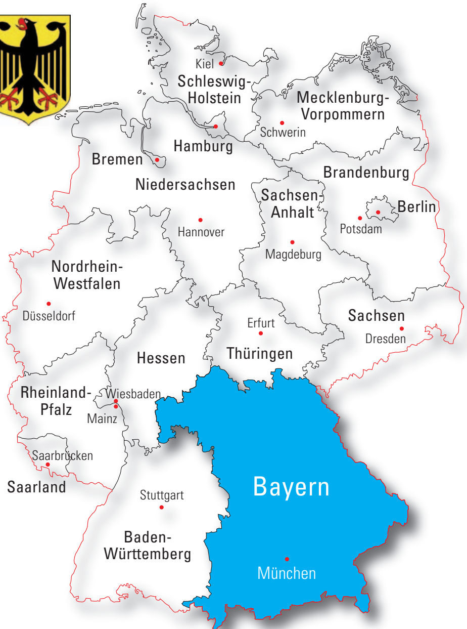
Die 16 deutschen Länder