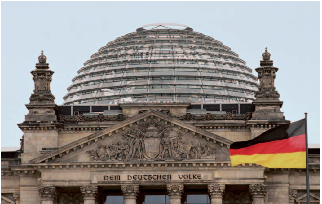
Unter der gläsernen Kuppel des Berliner Reichstagsgebäudes tagt seit 1999 der Bundestag