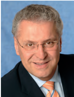
Joachim Herrmann Bayerischer Staatsminister des Innern