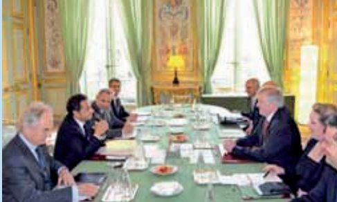
Ministerpräsident Seehofer zu Gast beim französischen Staatspräsidenten Sarkozy im Élysée-Palast.

Ministerpräsident, Minister und Staatssekretäre stehen in fortlaufenden Gesprächen mit Regierungen anderer Staaten über die Fülle gemeinsamer Interessen und Anliegen. Diese Treffen sind eine wichtige Quelle für Informationen über europäische und internationale Entwicklungen und geben oft Impulse für eine weitere Zusammenarbeit der Verwaltungen auf Arbeitsebene. Meist finden mehrere solche Termine pro Woche statt, im In- und Ausland, mit öffentlicher Aufmerksamkeit oder im Hintergrund.