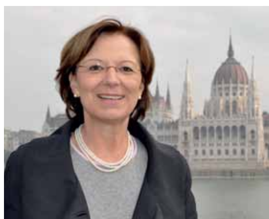
Staatsministerin Emilia Müller vor dem ungarischen Parlament.

Die Staatsregierung ist offen für Projektvorschläge zur weiteren Vertiefung der Zusammenarbeit im Donaauraum. Alle Mittel werden dafür eingesetzt, von den gemeinsamen Regierungskommissionen über die