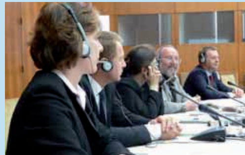
Sitzung einer Regierungskommission.

Dreizehn gemeinsame Regierungskommissionen und mehrere Arbeitsgruppen unterstützen die enge fachliche Zusammenarbeit zwischen Bayerns Partnern und der Staatsregierung auf bilateraler und multilateraler Ebene durch Vereinbarung konkreter Projekte. Über die Arbeitsgemeinschaft der Alpenländer (Arge Alp) und die Internationale Bodenseekonferenz (IBK) bestehen vielfältige Kontakte mit der Schweiz, Österreich und Norditalien. Innerhalb Europas fokussiert die Staatsregierung ihre Arbeit auf die Staaten in Mittel-, Ost- und Südeuropa. Weltweit besteht ein Netzwerk der Partnerregionen.