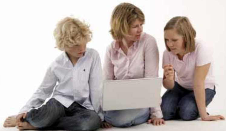
Abb. 09: Kinder und Jugendliche brauchen eine Vertrauensperson

Kinder und Jugendliche sollten wissen, dass sie unangenehme Erfahrungen im Netz nicht für sich behalten sollen. Für jüngere Kinder sind die Eltern die erste Anlaufstelle, ältere Kinder und Jugendliche wenden sich mit ihren Fragen manchmal lieber an andere Erwachsene, zum Beispiel Lehrerinnen oder Lehrer, die Jugendgruppenleitung.