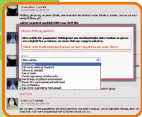
Abb. 05: Melde-Funktion, SchülerVZ

Im Gespräch können Sie sich mit Ihren Töchtern und Söhnen darüber austauschen, wofür diese das Internet nutzen. Wenn Sie Interesse und Verständnis zeigen, haben Sie auch die Möglichkeit, Ihren Kindern ins Bewusstsein zu rufen, dass nicht immer klar ist, wer Zugang zu ihren persönlichen Daten hat. Um unliebsame Erfahrungen zu vermeiden, sollten Jugendliche gut überlegen, welche Informationen sie welchen Personen aus ihrem ‚Freundeskreis‘ zugänglich machen. Dies gilt auch für Bilder, denn was einmal ins Internet gestellt wurde, kann nicht immer problemlos wieder entfernt werden. Hier gilt: „Das Internet vergisst nichts!“