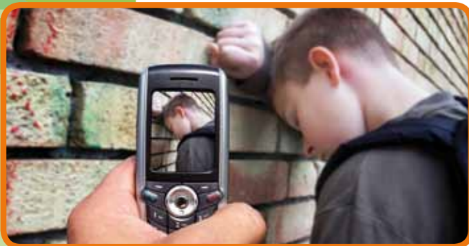
Abb. 06: Mobbing

auch Lehrkräfte), an die sie sich wenden können. Mobbing muss zum Thema gemacht werden und das am besten schon bevor es akut wird. Erwachsene neigen manchmal dazu, den Heranwachsenden zu empfehlen, einfach nicht mehr online zu gehen. Das hilft diesen meist nur wenig. Erstens sind die Community, der Chat und das Handy für sie ein zentraler Ort, um mit ihren Freunden in Kontakt zu sein. Aus Angst, das von den Eltern verboten zu bekommen, vertrauen sich die Kinder ihnen lieber gar nicht erst an. Zweitens findet das Mobbing häufig nicht ausschließlich im Netz statt. Hier hilft eine offene Haltung der Eltern für die Mediengewohnheiten ihrer Kinder und die Bereitschaft zum Gespräch.