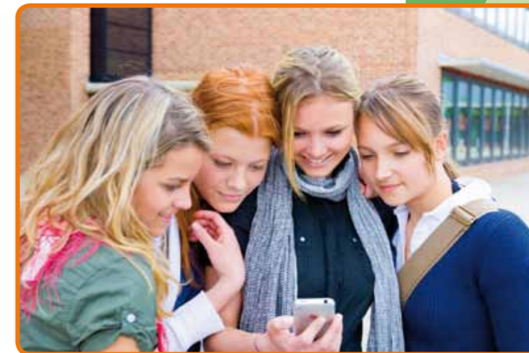
Abb. 03: Immer online – auch mobil

Auf den folgenden Seiten möchten wir Ihnen diese Risiken näher erläutern und Möglichkeiten aufzeigen, wie Sie Kinder und Jugendliche dabei unterstützen können, einen sicheren Umgang mit dem Web 2.0 zu lernen.