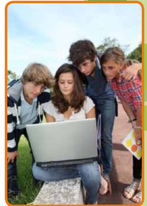
Abb. 02: Jugend im Netz