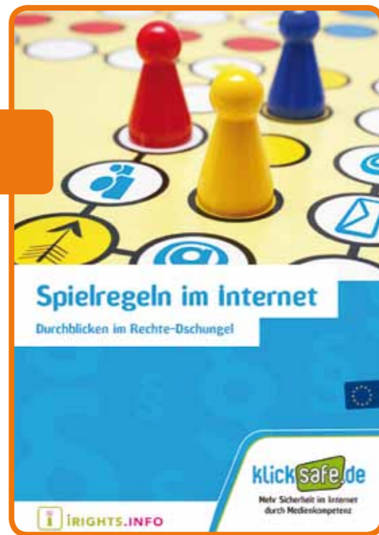
Abb. 11: Broschüre: Spielregeln im Internet