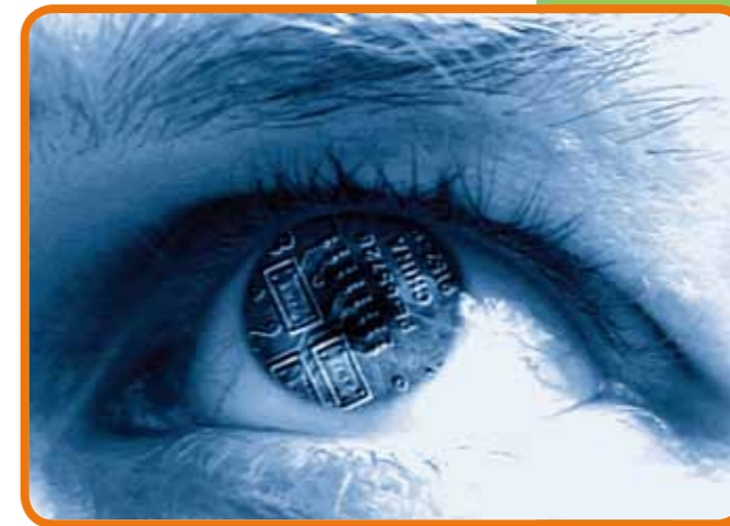
Abb. 07: Cyber-Mobbing ist Mobbing!

Bleiben diese Wege erfolglos, sollte je nach Schwere der Mobbing-Attacken entschieden werden, ob man professionelle rechtliche Hilfe hinzuzieht.