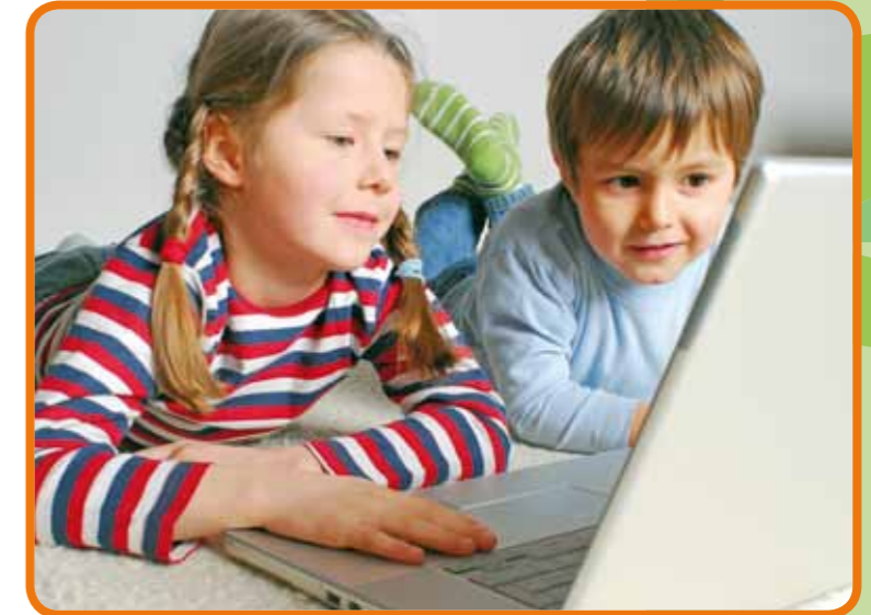
Abb. 01: Kinder im Netz

Kinder fühlen sich vom Internet angezogen. Sie brauchen aber noch Unterstützung, da ihnen für einen sicheren und kompetenten Umgang noch Fähigkeiten und Fertigkeiten fehlen. Da das Internet zu weiten Teilen auf Schrift basiert, ist die Lese- und Schreibfähigkeit eine wichtige Voraussetzung. Darüber hinaus müssen sie verstehen, wie das Internet aufgebaut ist, also beispielsweise was ein Link ist oder dass eine Seite aus mehreren Unterseiten besteht. Kinder im Grundschulalter sind damit noch überfordert. Ihre ersten Schritte im Internet sollten Kinder deshalb gemeinsam mit den Eltern machen. Wenn Sie ihr Kind das Internet allein nutzen lassen, sollten Sie darauf achten, dass es sich auf sicheren Seiten bewegt. Solche sicheren Seiten sind zum Beispiel Kindersuchmaschinen wie blindekuh.de , fragFINN.de , helles-koepfchen.de . Chat-Möglichkeiten für Kinder bieten seitenstark.de , kindernetz.de und kindersache.de . Für Kinder, die erste Erfahrungen in einer Online-Community sammeln möchten, gibt es die Kinder-Community des KI.KA mein!kika.de oder die Fotocommunity knipsclub.de .