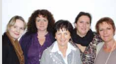
Die Sprecherinnen der LAG der Bayerischen Gleichstellungsstellen